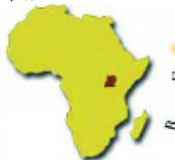
Uganda og Kishenyi er markert på afrikakartet.