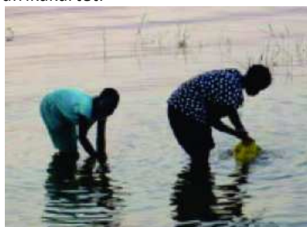
Du klarer deg sikkert en dag uten reint vann - men hva med en uke, et år, eller et heilt liv ?